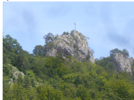
Situation und Plan der Bännliburgen

Von beiden Bännliruinen sind nur geringe Mauerreste und in den Fels gehauene Balkenlöcher und Fundamentlagen sowie ein natürlicher Graben zu sehen. Historische Nachrichten fehlen. Da die Klöster Beinwil (SO) und St. Alban (BS) schon im 12. Jh. in den Dörfern Wahlen und Grindel begütert waren, kann man dies als indirekten Hinweis auf ein frühes herrschaftliches Familiengut verstehen: die Familie(n) hätten dann die beiden Bännliburgen bewohnt. – Auf der andern Seite des Wahlenbachs liegt, ebenfalls auf einem markanten Felskopf, die Ruine Neuenstein, Rodungsburg einer Basler Familie, bei der es sich um die Nachfolgebürg der aufgelassenen Bännliburgen handeln könnte. Ursprünglich wollten wir auch diese Burgruine besuchen, doch wegen der Unmöglichkeit einer direkten Wanderwegverbindung müssen wir dieses Ziel fallen lassen (vielleicht nächstes Jahr?).