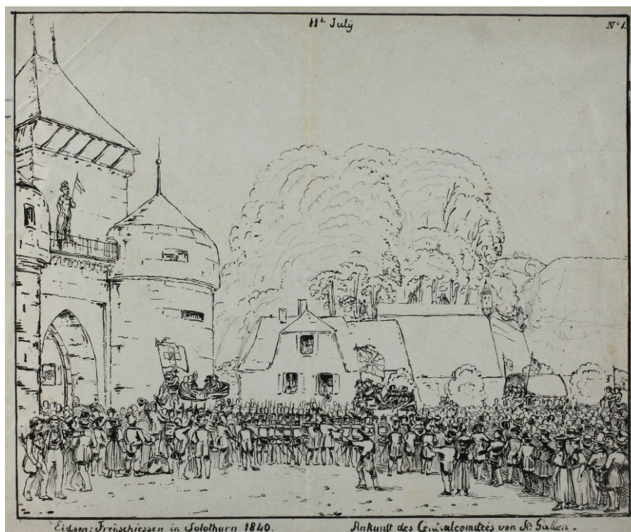
Solothurn, vor dem Baseltor, Eidg. Schützenfest 1840. Grafiksammlung Zentralbibliothek Solothurn, Signatur a1070

Liebe Burgenfreundinnen, liebe Burgenfreunde